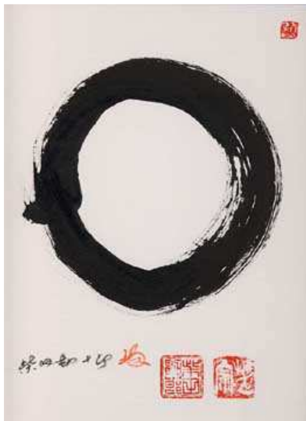
Calligraphie de Kanjuro Shibata XX "Ensō (円相)"

Je viens d'une liberté créatrice absolue qui a décidé de s'incarner en conscience dans la limitation de l'espace et du temps. Et vous ?