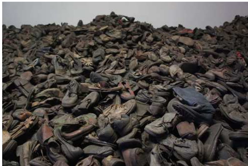
Auschwitz Shoes

Mémoire, mémoire brûlante, pourquoi ne dors-tu pas ? Qu'est-ce qui te tient éveillée ainsi dans la nuit qui s'appesantit ? J'entends ton murmure sourd qu'on ne saurait taire, le grondement de ton râle dans le vent qui gémit. Tu dis l'errance des fantômes gris décharnés qui habitent l'envers de notre temps, en quête d'une sépulture dans la terre riche de nos cœurs endormis. Hélas, Dieu est mort à Auschwitz ! Il avait le regard clair d'une jeune fille éprise de la vie, la tendresse d'une mère désespérée de serrer contre son sein un corps à jamais glacé, le souffle rauque d'un homme qui attend la fin comme une miséricorde, des douleurs articulaires dues à son grand âge, et bien sûr, ton sourire qui demeure et renaît toujours, comme soleil perçant enfin la cendre de notre indifférence.